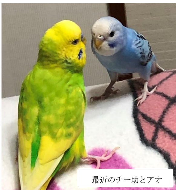
最近のチー助とアオ

環境を壊すのは人間だけとは思いませんが、環境を少しでも取り戻せるのは人間かもしれません。 江島光弘、記