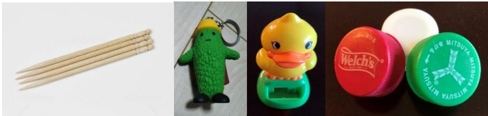
かつて沢山遊んだが、だんだん遊ばなくなってきた道具やおもちゃ

ーホルダー、アヒルの置物、ペットボトルの蓋で遊んでいました。現在では下の写真にあります、ステック状の塗り薬、テレビのリモコン、ティッシュペーパーの箱、ペットボトルと良く遊びます。それぞれ雌に見立てているようで、手をつつきに来ます。「邪魔するな！」？